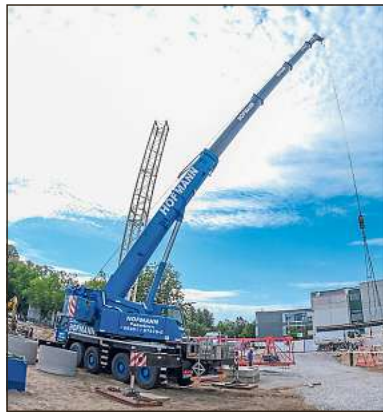
Der 13 Meter hohe Kran wird gerade aufgebaut.