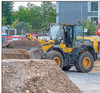
Die Bauarbeiten an Hallenbad und Gesamtschule dauern vier Jahre. Wenn alles gut läuft, wird 2027 Einweihung gefeiert.