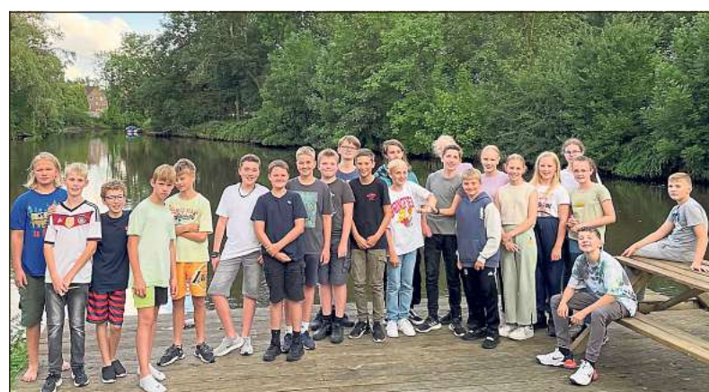
31 junge Menschen haben jüngst mit dem Droste-Haus eine ereignisreiche Fahrt nach Emden erlebt.

Auch dem Otto Huus statten die jungen Menschen einen Besuch ab, wo sie auf den Spuren des bekanntesten Einwohners Otto Waalkes wandelten. „Die Stimmung war trotz des vielen Regens richtig gut und nach der Disco und dem gemütlichen Lagerfeuer am Abschlussabend haben die Teilnehmer ein bisschen müde, aber vor allem sehr zufrieden auf die Woche zurückgeblickt“, erzählt Simone Pankoke.