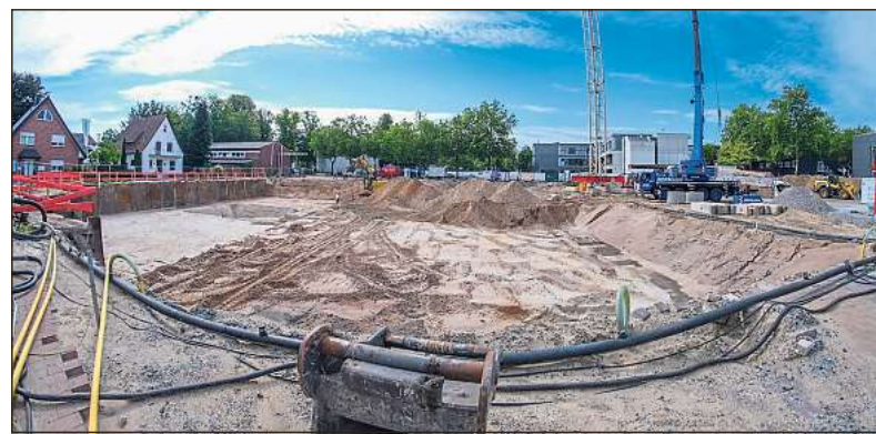
Die rund fünf Meter tiefe Baugrube für das Hallenbad ist bereits ausgehoben. Bald beginnt das Gebäude zu wachsen.